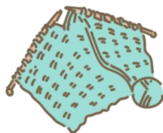
「仮設にて」 藤島昌治・詩 より