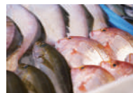
「お魚の日」はト箱で販売!

「JAのお魚屋さん」には、鮮魚、加工魚、塩干品を中心に、瀬戸内海産、山陰産、国内産の品質の高い水産物を販売しております。素材とおいしさにこだわった目利きで、安全・新鮮な国産水産