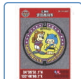
サンフレッチェ広島 コラボマンホールカードもゲット出来る!