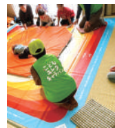
③揺れマットで揺れから安全に逃げる!