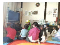
①この部屋の危険はどこ？

次は揺れから身を守り逃げる訓練を行います。考えるきっかけに最適な取り組みの一つだと実感しています。（もちろん家具の固定、飛散防止フィルムの対策は必須です。）