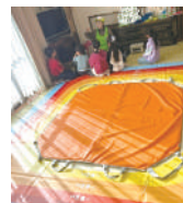
②どこに逃げたら良い？