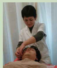
山村鍼灸治療院 広島市中区宝町 6-30 レガロ番館 301 TEL080-6243-3631