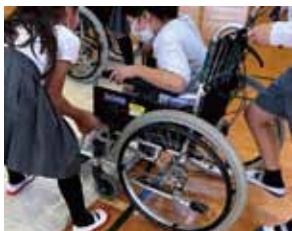
難しいシーンも友達の影響で自信をつける体験学習の一コマ

この基本構想には「心のバリアフリー」に関する教育啓発事業計画が含まれ、県内市町でやさしさ発見プログラムが深化することを期待します。