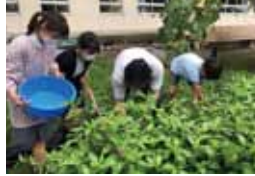
三篠小学校の6年生が育てた藍の収穫

江戸から明治時代にこの場所で盛んだった藍づくりを地域活動や三篠小学校6年生の授業で取り上げて頂きました。