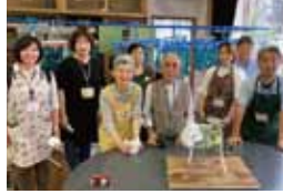
一緒に授業に取り組んだプロジェクトのメンバー