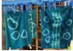
思い思いの紋りが素敵な世界に一つの作品