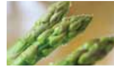
寒暖の差が激しく、農産物の育成に適した立地条件で育てられた新鮮野菜や甘い果物。

そんな世羅町の魅力を発信する道の駅世羅では、「せらインフォメーションカウンター」に観光コンシェルジュを置き、パンフレットの配布やチケット販売、町内の観光施設や飲食店などを周遊する際の、旬な情報を提供しています。また、ハブ拠点としての機能のほか、新鮮な地元の旬の食材を生かした季節を感じられるフードコーナーや、旬の野菜や果物の産直市などが充実しています。