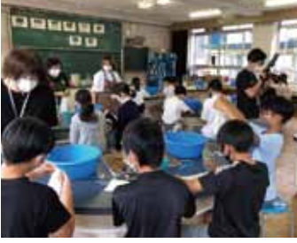
絹の古布を使ったハンカチの藍の生葉染め授業